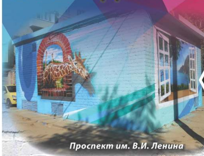
Проспект им. В.И. Ленина