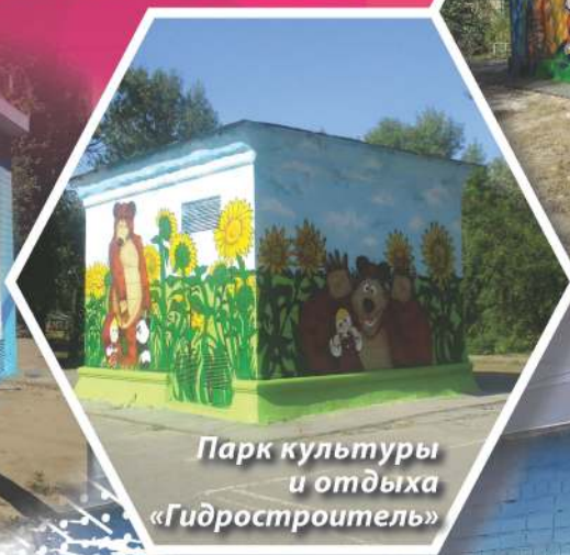
Парк культуры и отдыха «Гидростроитель»