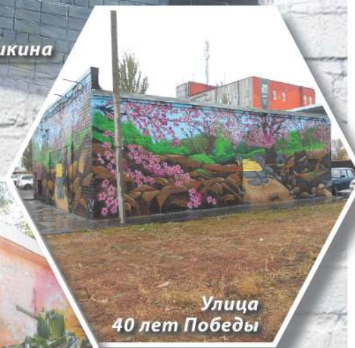
Улица 40 лет Победы