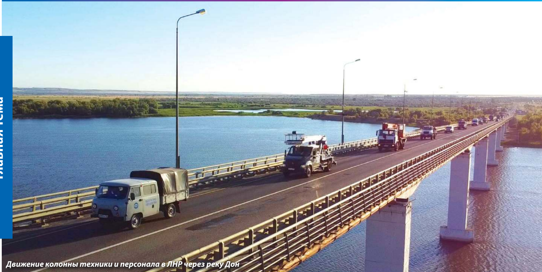
Движение колонны техники и персонала в ЛНР через реку Дон