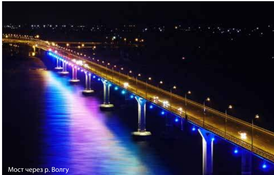
Мост через р. Волгу

ПАО «Волгоградoblэлектро» принимает активное участие в проектах по формированию комфортной городской среды и развитию инфраструктуры региона в целом. К 75-летию Великой Победы Советской Армии под Сталинградом, а также в рамках подготовки города-героя к чемпионату мира по футболу 2018 года успешно реализован ряд социально значимых проектов.