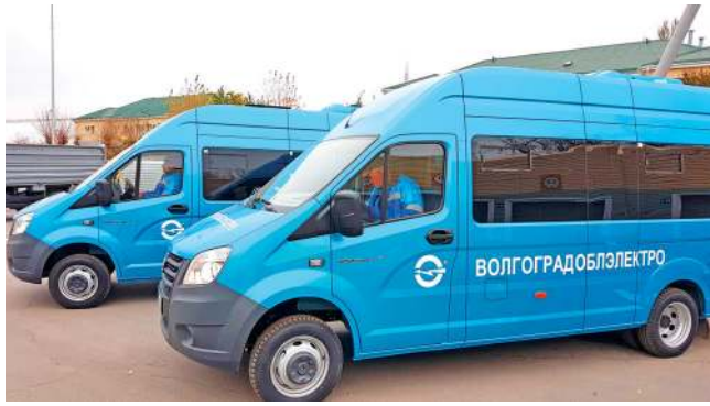
СРОК ЭКСПЛУАТАЦИИ ТРАНСПОРТНЫХ СРЕДСТВ

Передвижная электротехническая лаборатория на базе ГАЗель NEXT передана в эксплуатацию