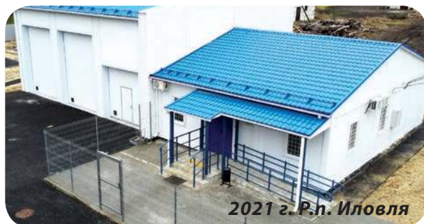
2021 г. Р.п. Иловля