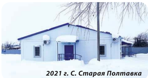
2021 г. С. Старая Полтавка