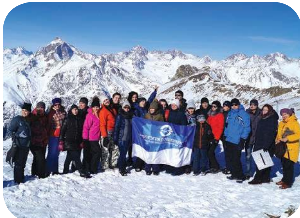
Экскурсионный тур на курорт в высокогорном районе Кавказа, у подножия Эльбруса

Задать интересующие вопросы председателю профсоюзной организации можно по телефону 8 937 690 9006 или отправить сообщение на адрес электронной почты m.chebakov@voel.ru .