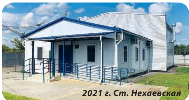
2021 г. Ст. Нехаевская

В этом году программа строительства современных зданий, а также комплексное благоустройство территорий производственных участков продолжается.