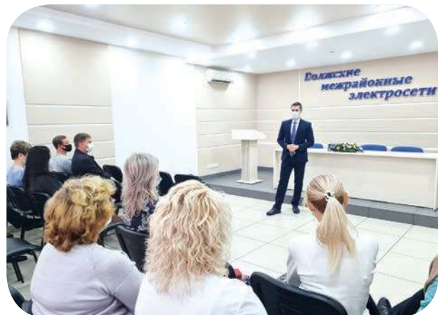
Рабочее собрание с коллективом филиала Волжские МЭС

В основе социально-трудовых отношений между работником и работодателем лежит коллективный договор – это определенные гарантии, учет взаимных интересов сторон. Мы решаем вопросы путем конструктивного диалога с руководством в интересах работников. Основываясь на принципах социального партнерства, профсоюз открыт для предложений и инициатив, важно участие каждого из нас. Чем многочисленнее общественная организация, тем ярче и интереснее жизнь нашего коллектива.