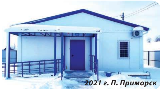
2021 г. П. Приморск