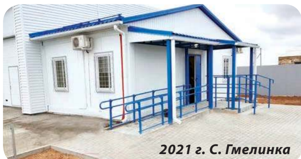
2021 г. С. Гмелинка