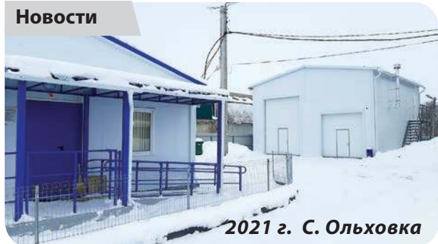
2021 г. С. Ольховка