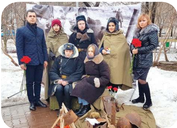
Участие в мероприятии ко Дню Победы в Великой Отечественной войне 1941-1945 гг.

«В прошлом году для организации досуга филиалов приобретен спортивный инвентарь. Представители Волжских МЭС, Камышинских МЭС, производственного участка в рабочем поселке Городище принимали участие в состязаниях по волейболу и футболу. В этом году планируются экскурсии в Адыгею, музей-заповедник «Старая Сарепта», природный парк «Щербаковский», курортный посёлок Домбай, а также участие в различных мероприятиях, – отметил председатель. – Вместе с тем на повестке дня вопросы расширения схемы маршрутов корпоративных автобусов».